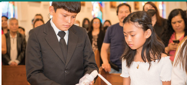
Encendidos por el Espíritu Santo; somos testimonio del amor de Dios.