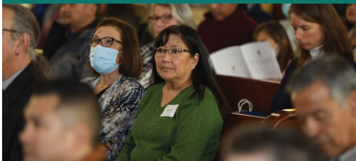
Chúng ta là một gia đình, một cộng đồng đức Tin.