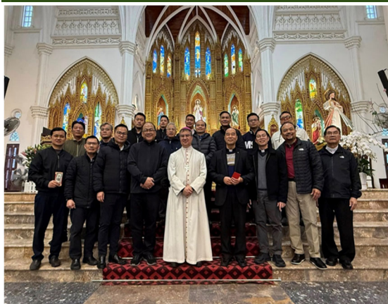
Thăm giáo phận Bùi Chu – At Bui Chu Diocese in Vietnam